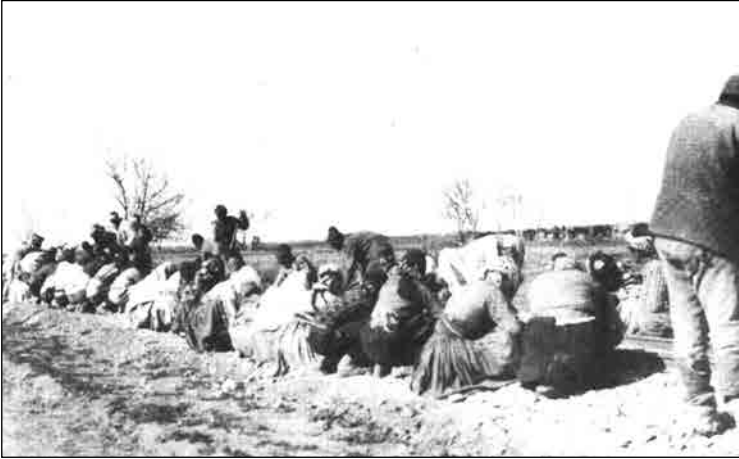
Afyon demiryolu hattını tamir eden kadınlar