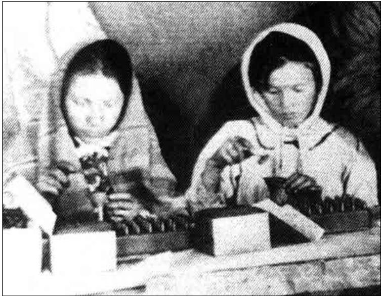
Cephane yapımında çalışan kız çocukları