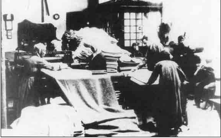
Askerin ihtiyacını karşılamak için dikimevlerinde çalışan kadınlar