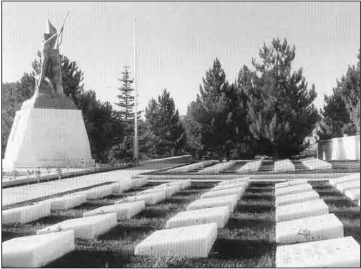
Afyon Yüzbaşı Ağah Efendi Şehitliği