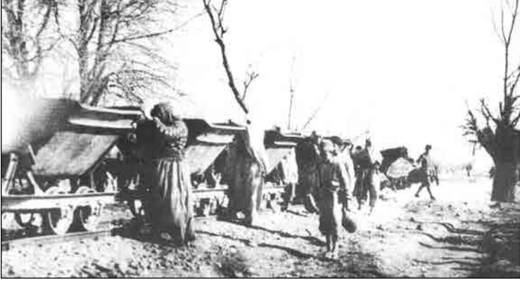
Azeriköy dekolvi hattında çalışan köylü kadınlar