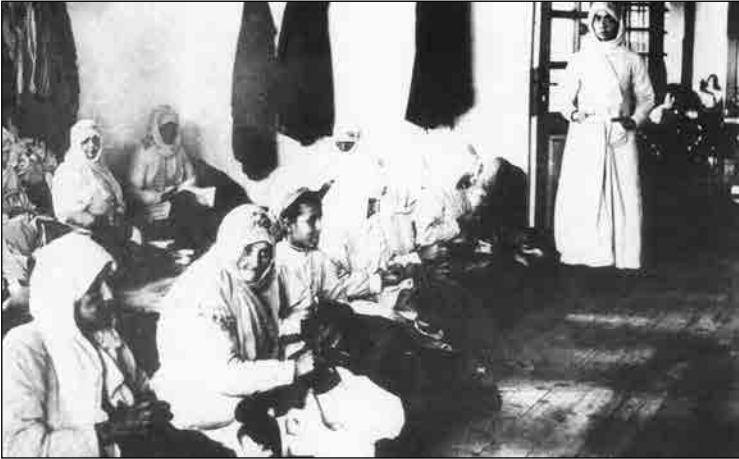
Cephedeki askerlere üniforma diken kadınlar