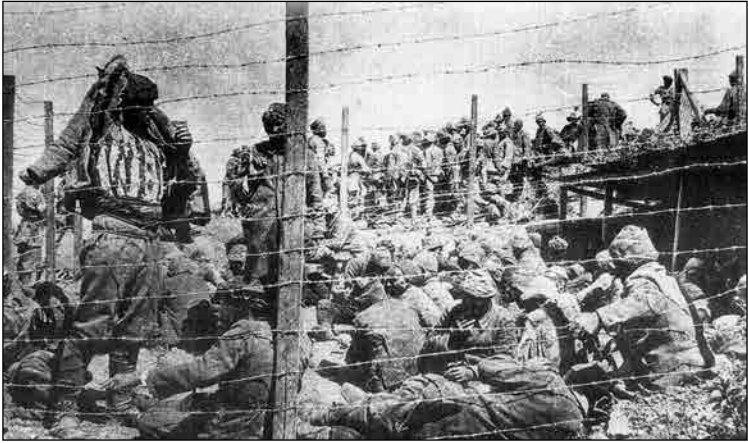
İngilizler tarafından esir alınan askerlerimizin hüznünlü bekleyiři