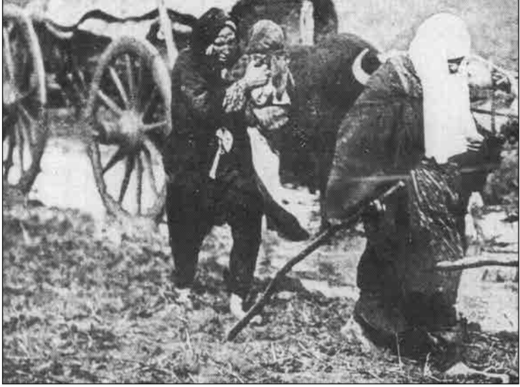
İşgal bölgelerinden yapılan göç