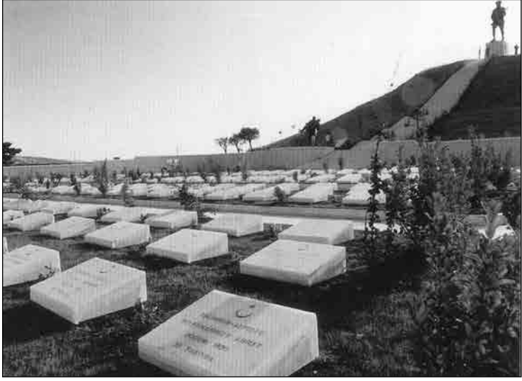
Dumlupınar Kurtuluş Savaşı Şehitliği