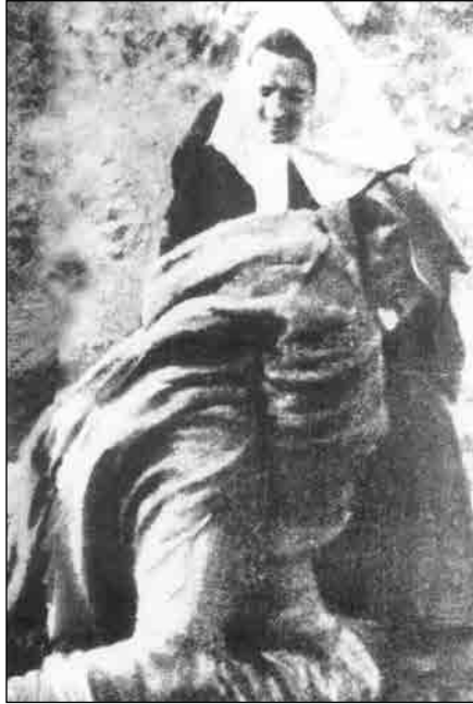
Yaralı askere yardım eden hemşire