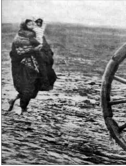
Çocuđuyla cephane nakliyatına katılan bir Anadolu kadını