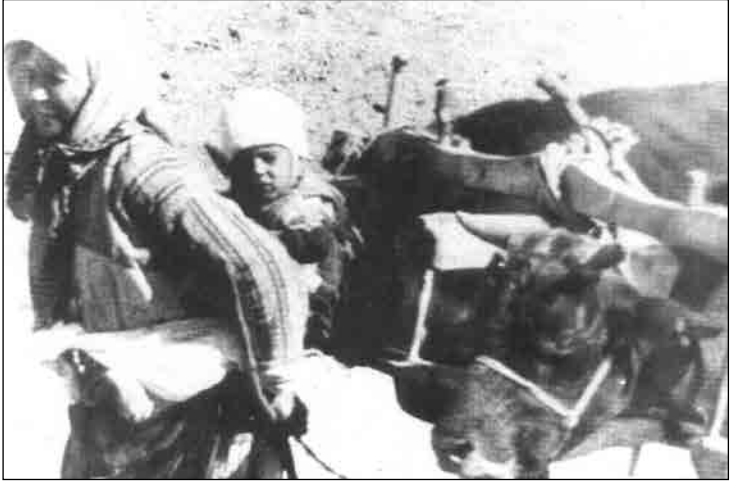
Sirtında çocuđuyla cephane taşıyan Anadolu kadını