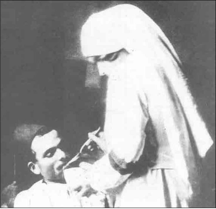
Yaralı askere yemek yediren hemşire